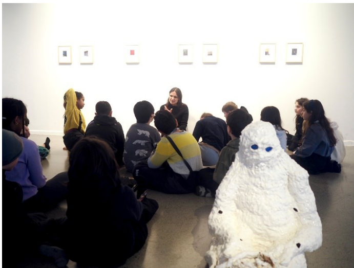
DKS formidling i eget galleri. Utstilling: HIGHER HIGHS, HIGHER LOWS.

Pilotgalleriet får god respons fra skolene på utstillingene som blir vist. Utstillingene har ulike uttrykk og er passelig store for visning i et klasserom. Formidlerne får generelt svært gode tilbakemeldinger.