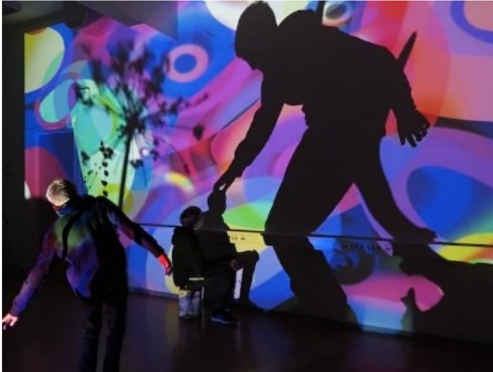
Fra produksjonen Screening.